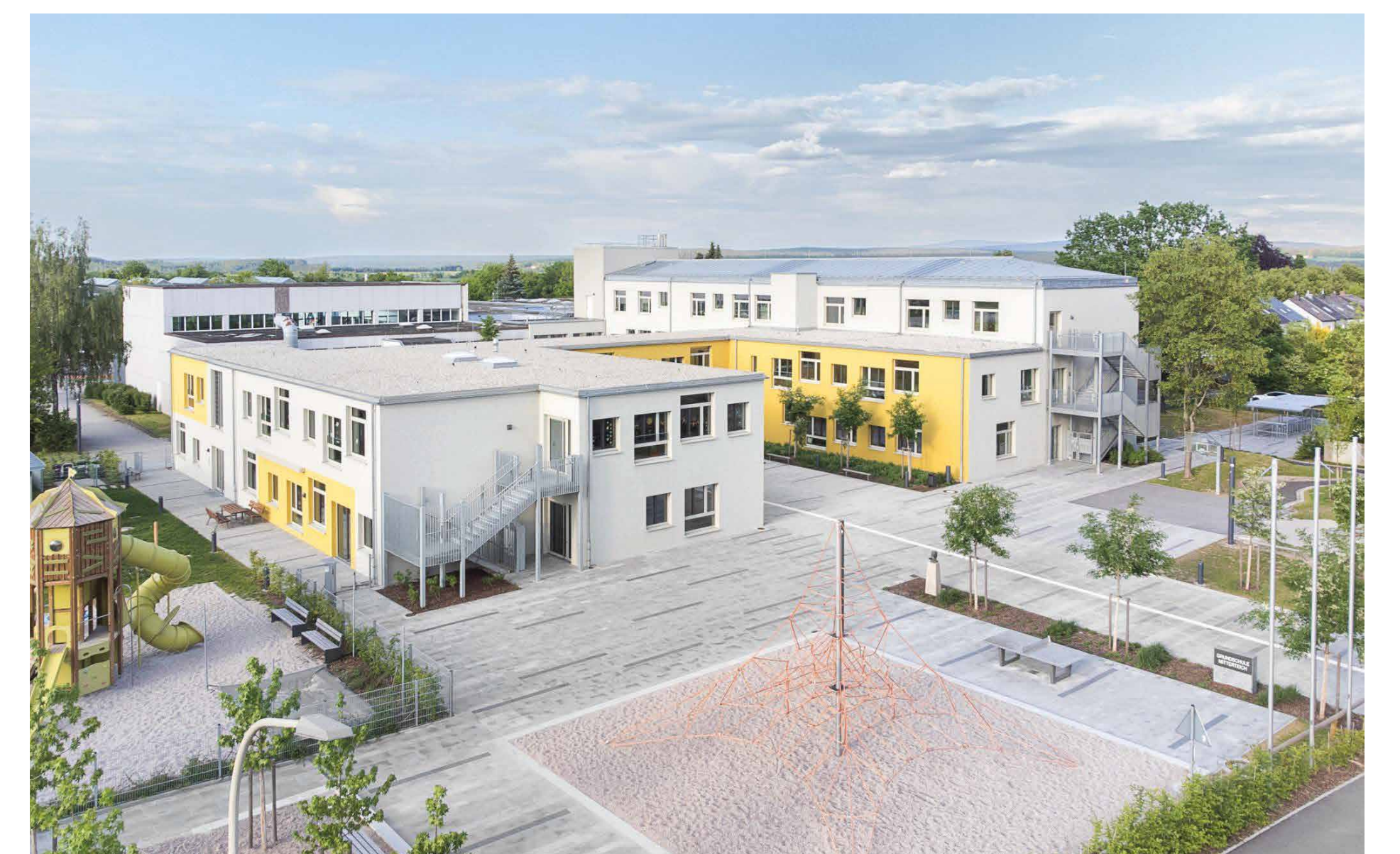
Schulkomplex mit Schulcampus

Mit der Sanierung und Erweiterung des dreigeschossigen Ostflügels und dem zweigeschossigen Anbau konnte eine kompakte Schulanlage mit kurzen Wegen und hoher Flexibilität geschaffen werden. Die Aula mit Mehrzweckraum dient als Zentrum des Schulcampus. Die Erweiterung wurde genutzt um flexible Lernlandschaften und zeitgemäße pädagogische Konzepte in den Klassenbereichen zu integrieren. Bestehende Bausubstanz wurde weitestgehend erhalten, ertüchtigt und erweitert. Nach der Sanierung erreichen die Altbauten den KfWEffizienzhaus 70 Standard, die Zubauten wurden im KfWEffizienzhaus 55 Standard errichtet. Die Baukörper gliedern die Außenanlagen in unterschiedliche Nutzungsbereiche. Der räumlich gefasste Eingangshof ist vielfältig nutzbar und dient vorrangig als Pausenhof. Als Integrative Schule hat die Sanierung mit Erweiterung Modellcharakter für die Stadt Mitterteich und die Region.