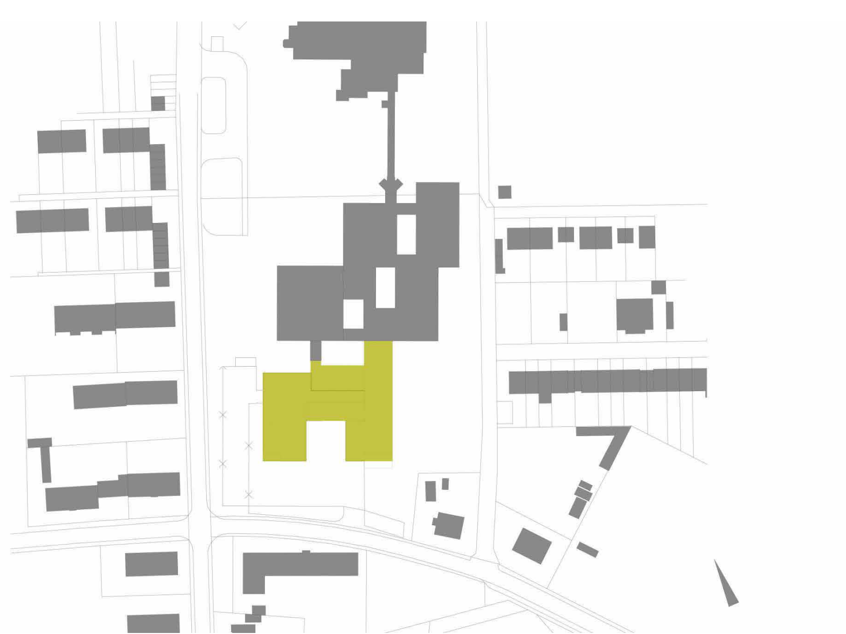
Lageplan © JURETZKA ARCHITEKTEN PartG mbB