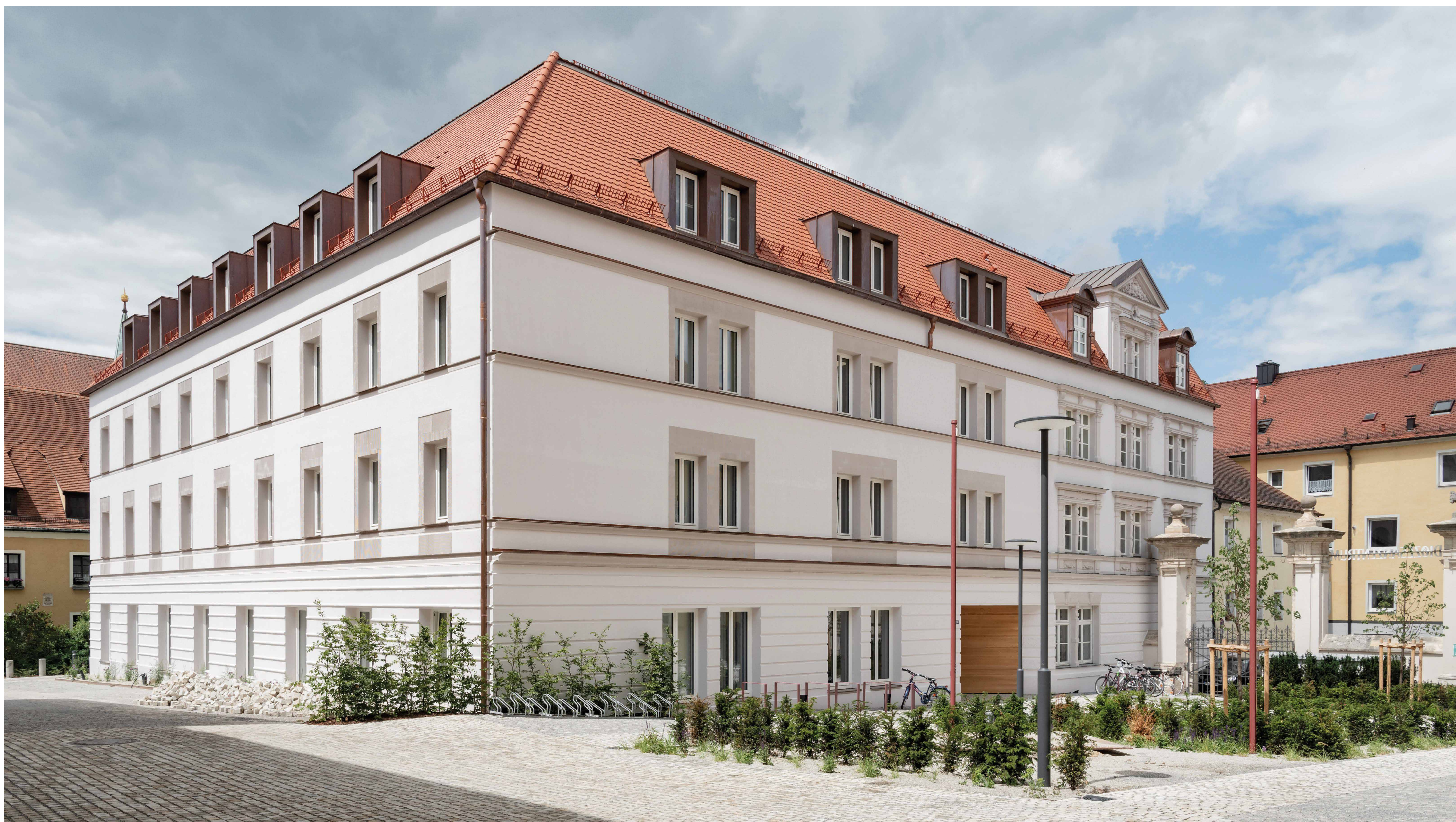
Ansicht von Süd Ost © Anton Mirwald