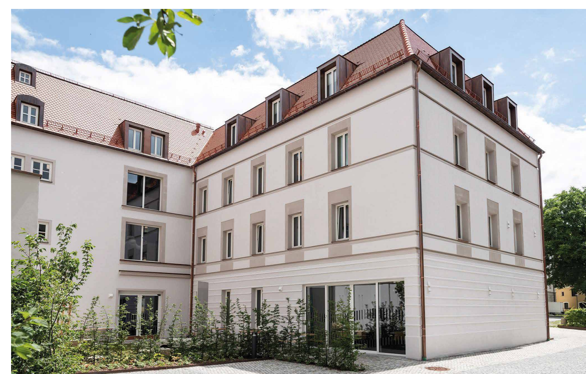
Ansicht von Nord Westen mit Innenhof © Anton Mirwald