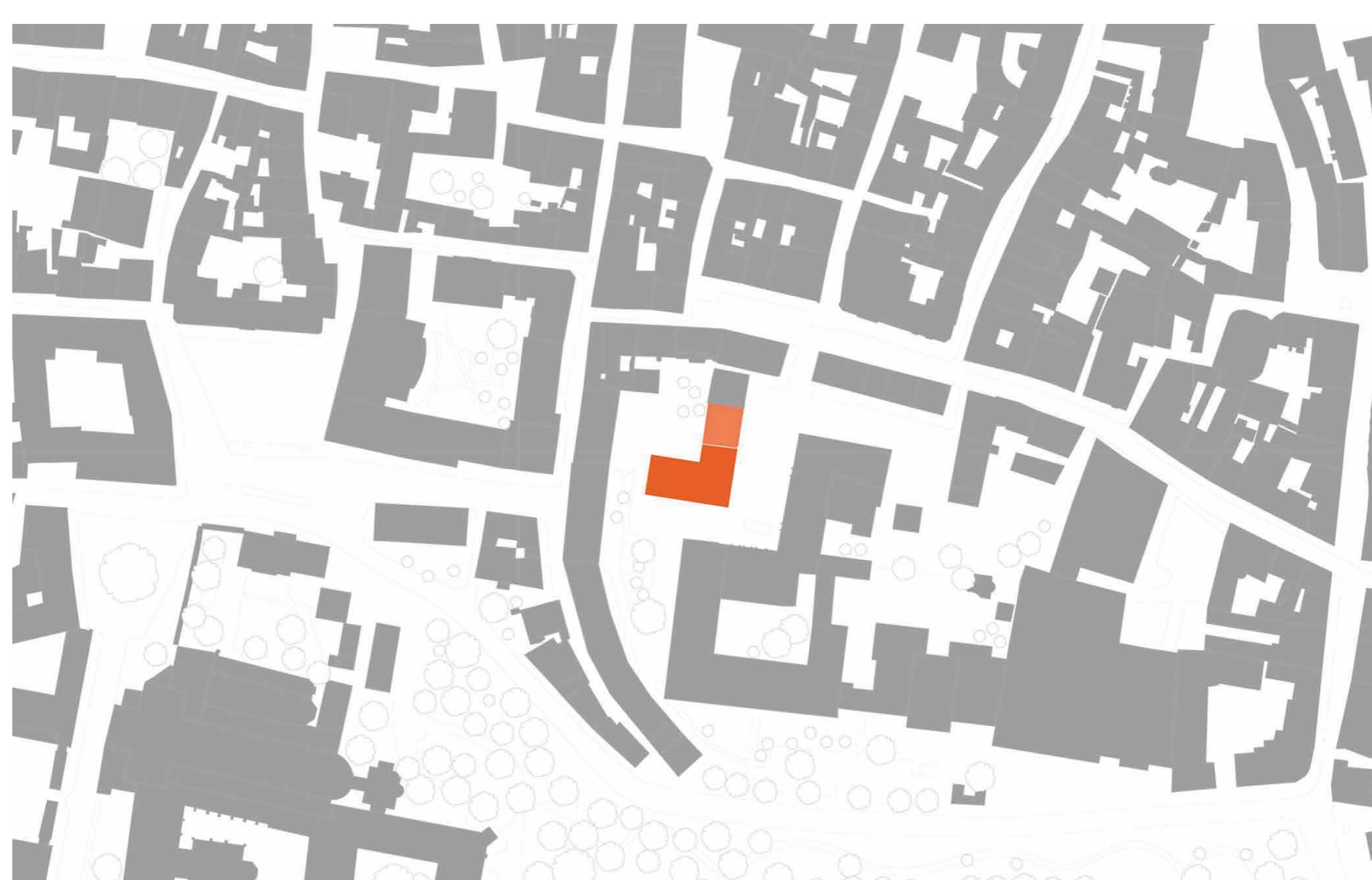
Lageplan © Gebauer Wegerer Wittmann Architekten