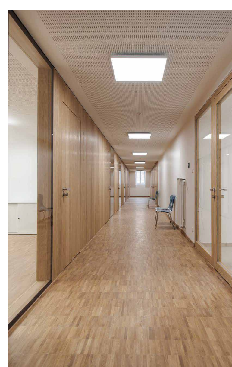
Flur Verwaltung