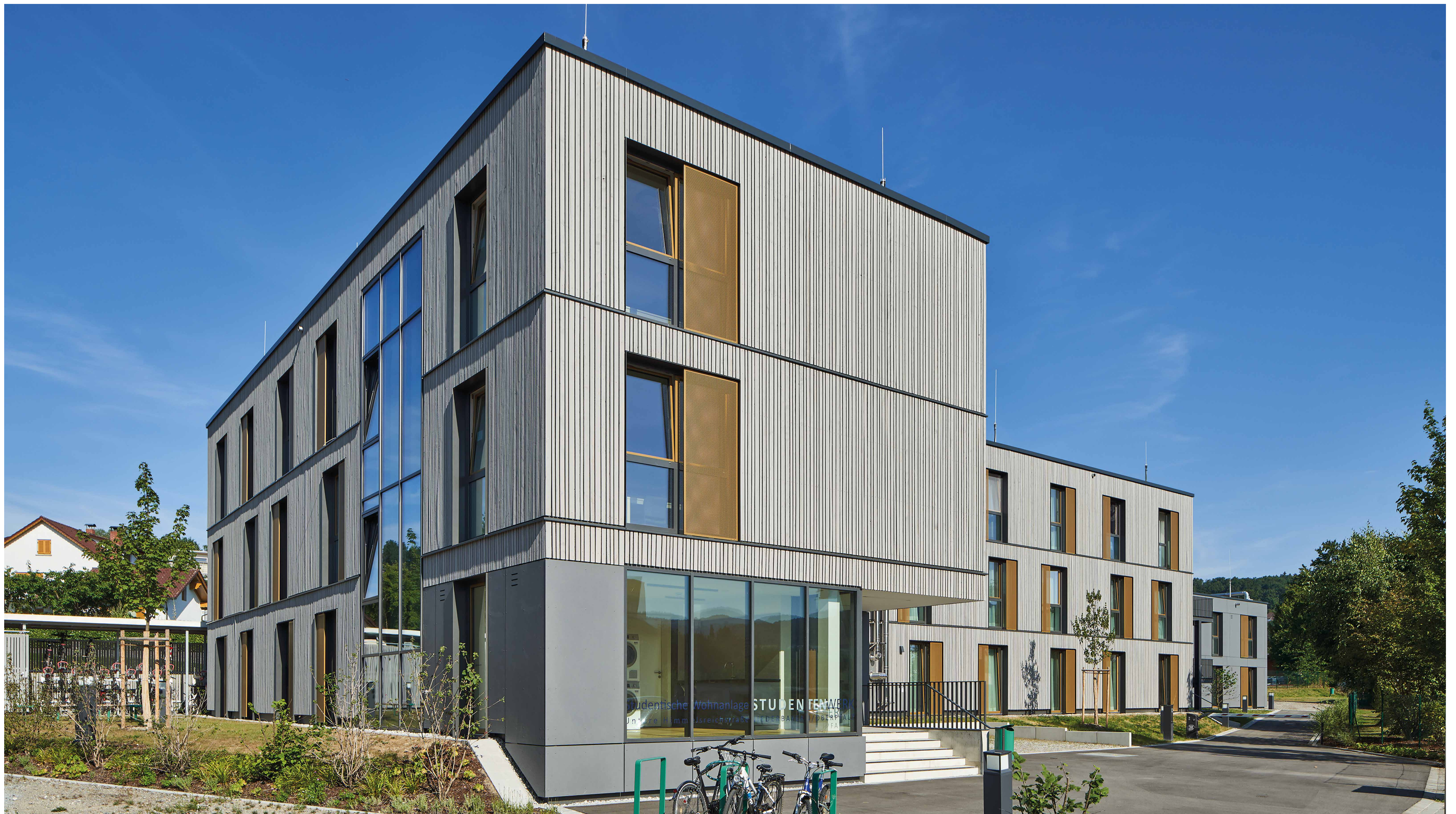
Wohnanlage für Studierende in Deggendorf