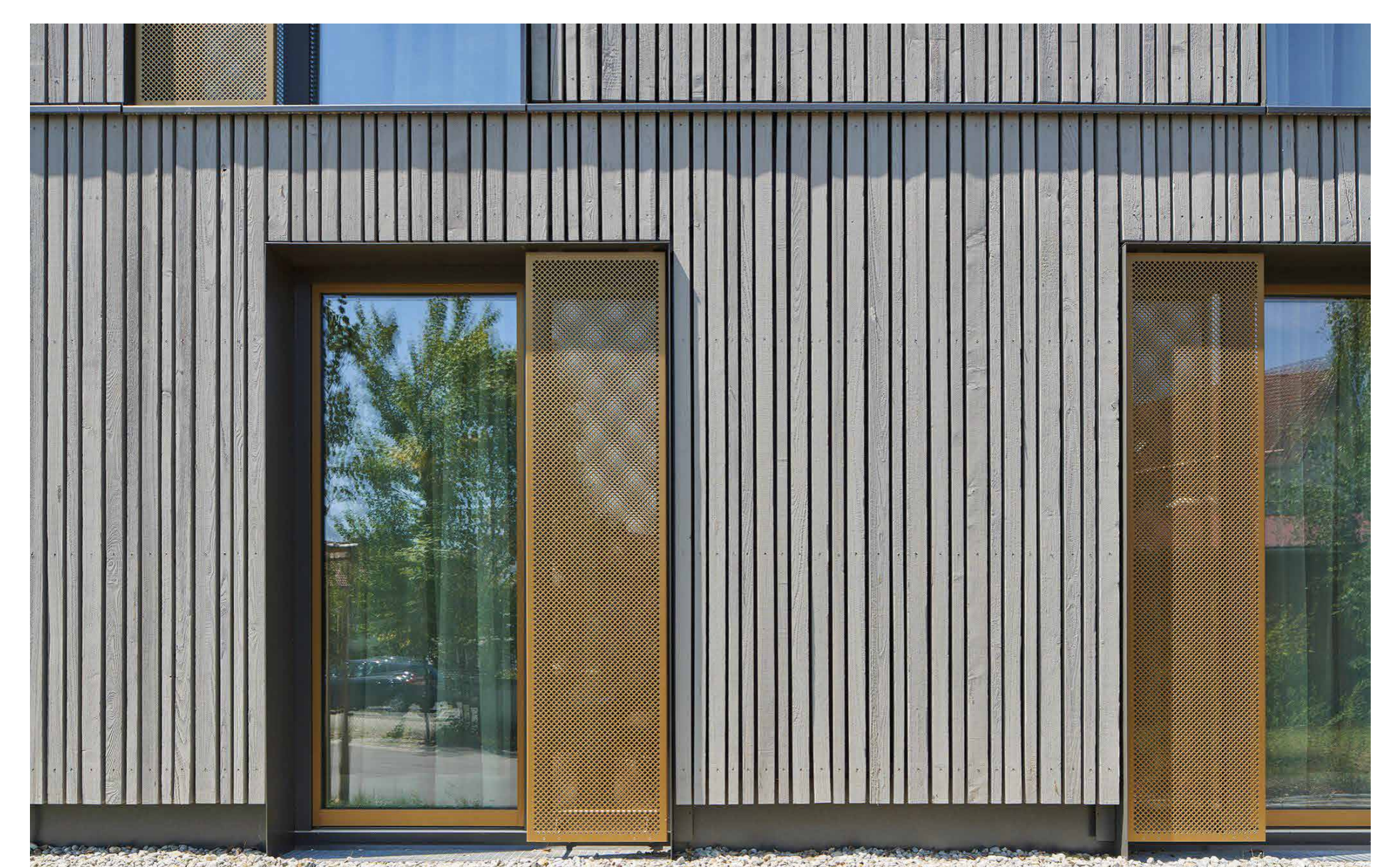
Die Fassade aus der Nähe