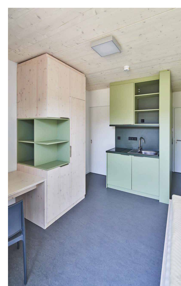
Blick in ein Apartment