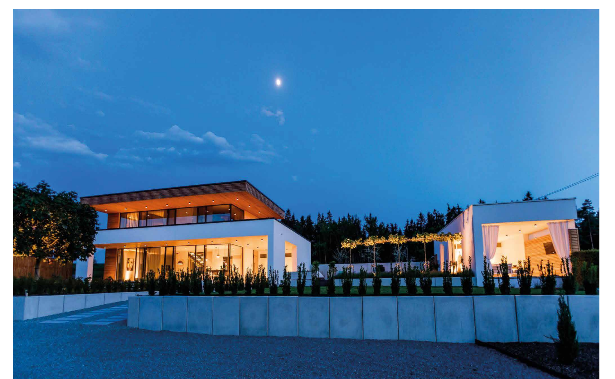
Gesamtansicht © bast + ascherl architekten