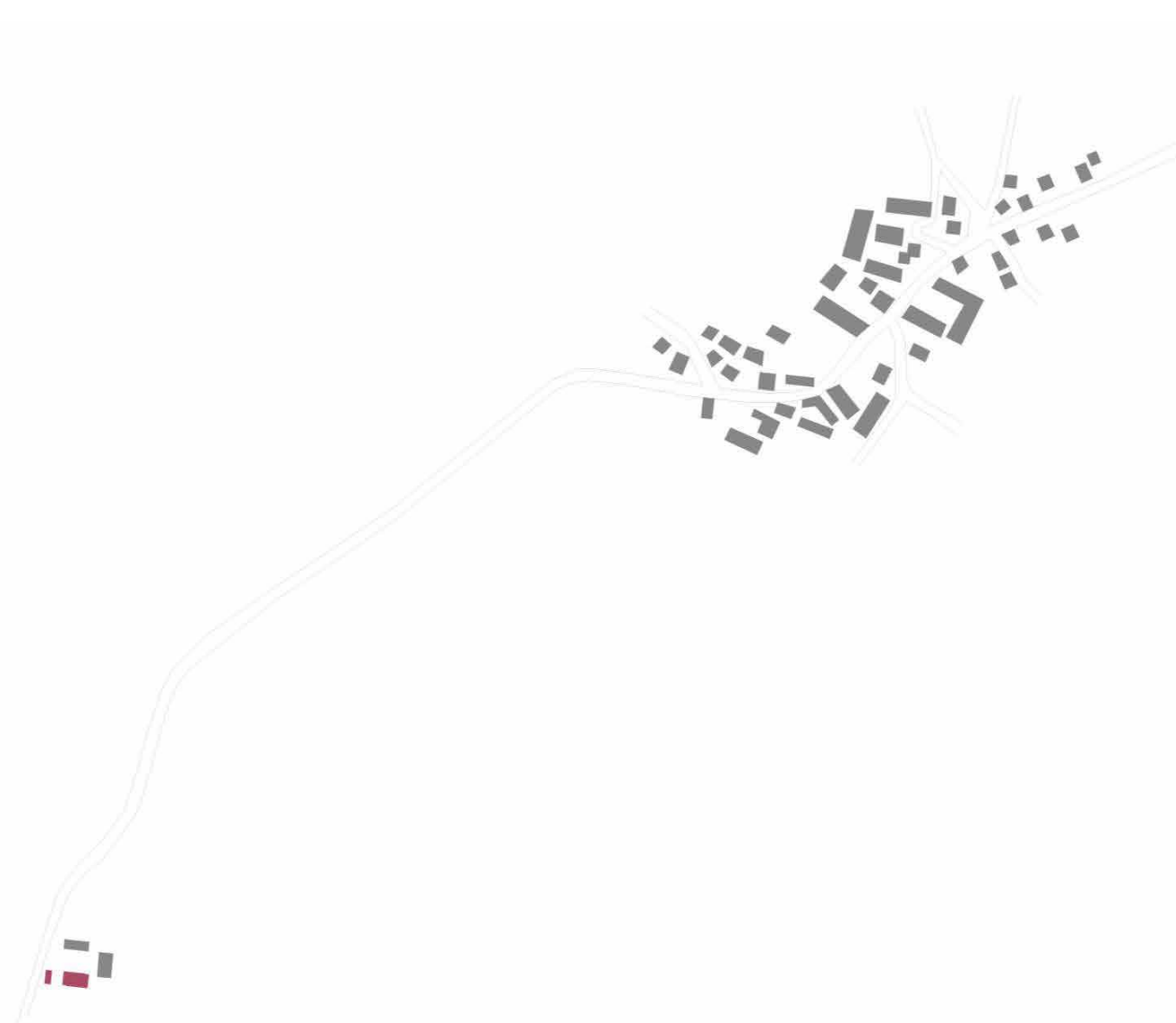
Lageplan © bast + ascherl architekten