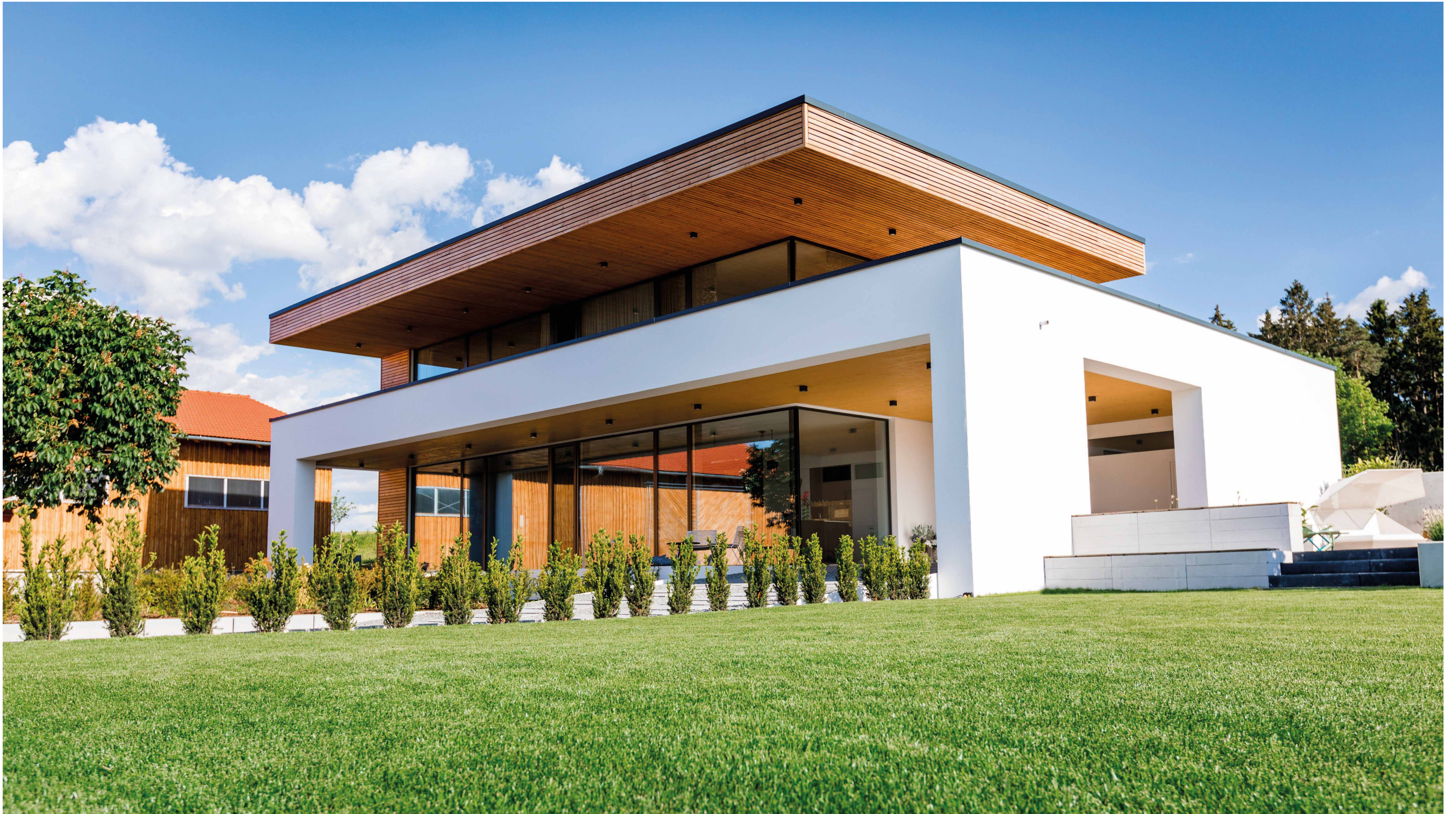
Nord-West-Ansicht © bast + ascherl architekten