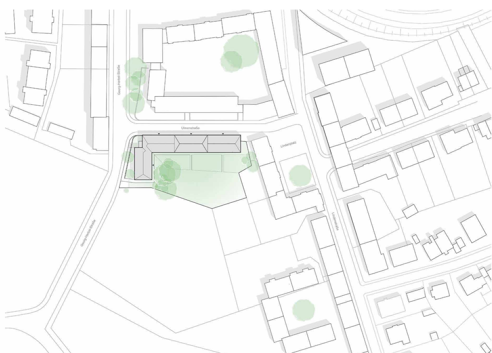
Lageplan © Luxgreen Climadesign