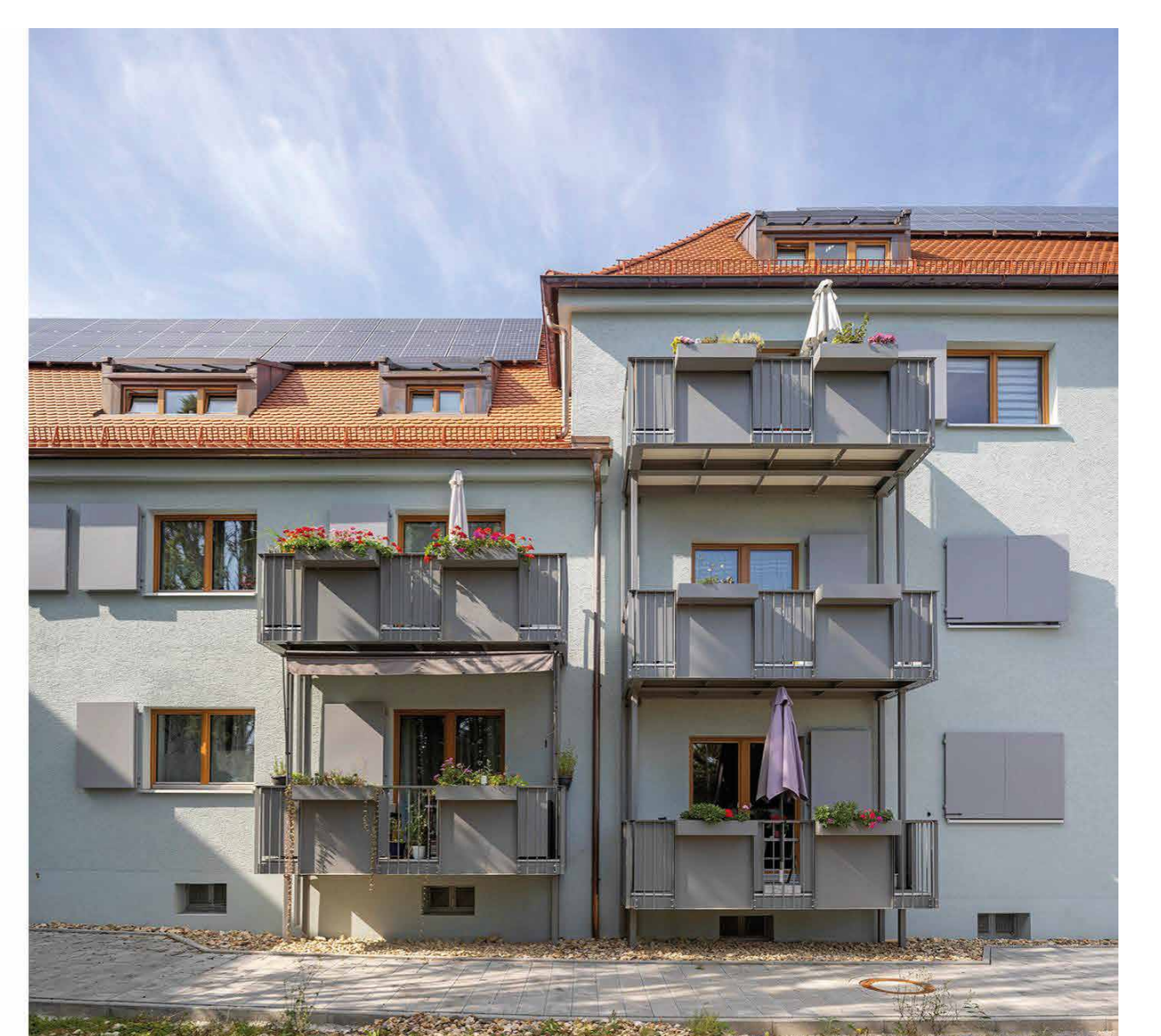
Balkone mit beweglichem Sichtschutz